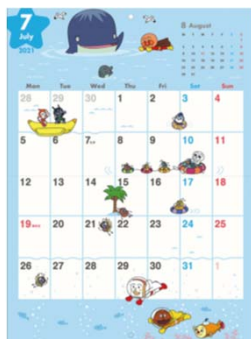
該当商品 (表紙・中面)