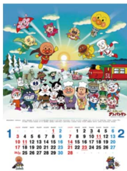
該当商品 (表紙・中面)